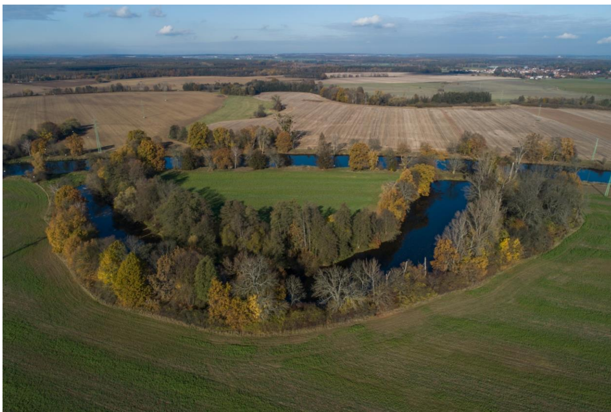
Labiště pod Opočínkem před zahájením revitalizace v listopadu 2019

Odstavené rameno Labiště pod Opočínkem vzniklo regulačním zásahem do trasy koryta Labe v průběhu 20. století. Rameno je odděleno od řeky pobřežním valem s cestou. Propojení s Labem je na obou stranách zajištěno potrubím umístěným svou dolní hranou na úrovni normální hladiny Labe ve vzdutí. Voda do ramene tedy natéká pouze v období zvýšené hladiny v Labi. Nedostatečný průtok umocňuje postupné zarůstání ramene a zhoršuje kvalitu vody. Labe je v tomto úseku ovlivněno vzdutím z jezu v Přelouči.