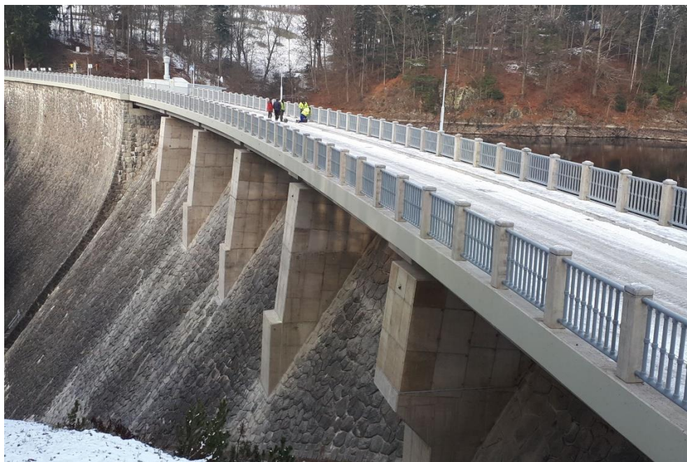
Rozšíření přemostění korunového přelivu

Rekonstrukce koruny hráze probíhala od července 2021 do listopadu 2022. Rekonstrukci provedla firma STRABAG Rail a.s. za 60,8 mil. Kč bez DPH. Akce byla spolufinancována z dotačního programu Ministerstva zemědělství „Podpora prevence před povodněmi IV“.