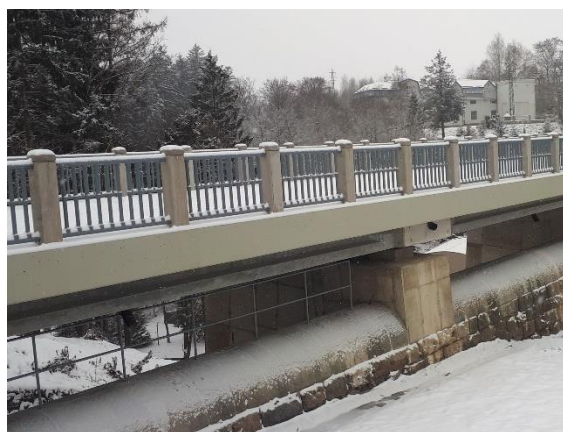
Nové bezpečné zábradlí

Přehrada Pastviny byla vybudována v letech 1933 – 1938. Slouží k částečné ochraně území pod hrází před povodněmi, nadlepšování průtoku v níže ležícím úseku řeky, výrobě obnovitelné elektrické energie ve špičkové vodní elektrárně a velmi oblíbená je pro rekreaci, vodní sporty a rekreační rybaření.