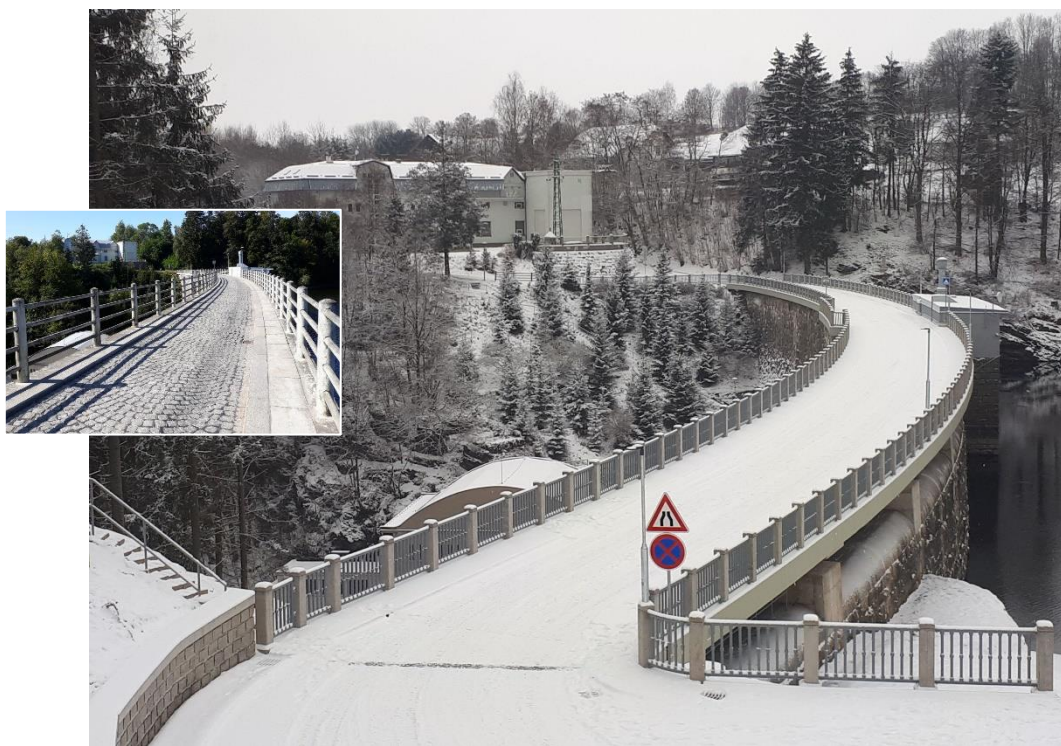
Hráz přehrady Pastviny na Divoké Orlici po rekonstrukci, na malém snímku původní stav

V rámci rekonstrukce koruny hráze bylo vyřešeno nevyhovující a provozně potenciálně nebezpečné šířkové uspořádání. Původní úzké přemostění korunového přelivu bylo odstraněno a místo něho bylo vybudováno zcela nové přemostění, takže komunikace na hrázi je po celé délce stejně široká. Na obou stranách byly zřízeny širší chodníky, pohyb vozidel i osob na hojně navštěvované přehradní hrázi je tak nyní bezpečnější. Kompletně bylo realizováno nové odvodnění koruny hráze, hydroizolace, zábradlí a osvětlení. Obnoveny a doplněny byly též prvky pro sledování některých veličin důležitých z hlediska technicko-bezpečnostního dohledu.