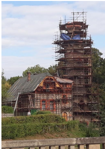
Les Království – dům hrázného při výstavbě v roce 1912 a při rekonstrukci v roce 2018