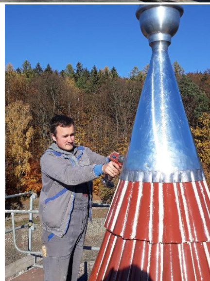
... a dále již byla v rukách odborníků z fy PARIO s.r.o., kteří navracejí střechám na přehradě jejich krásu