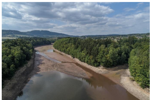
Les Království 6.9.2018 – rekonstrukce domu hrázného a průjezdových bran a nízká hladina v nádrži jako důsledek suchého léta 2018