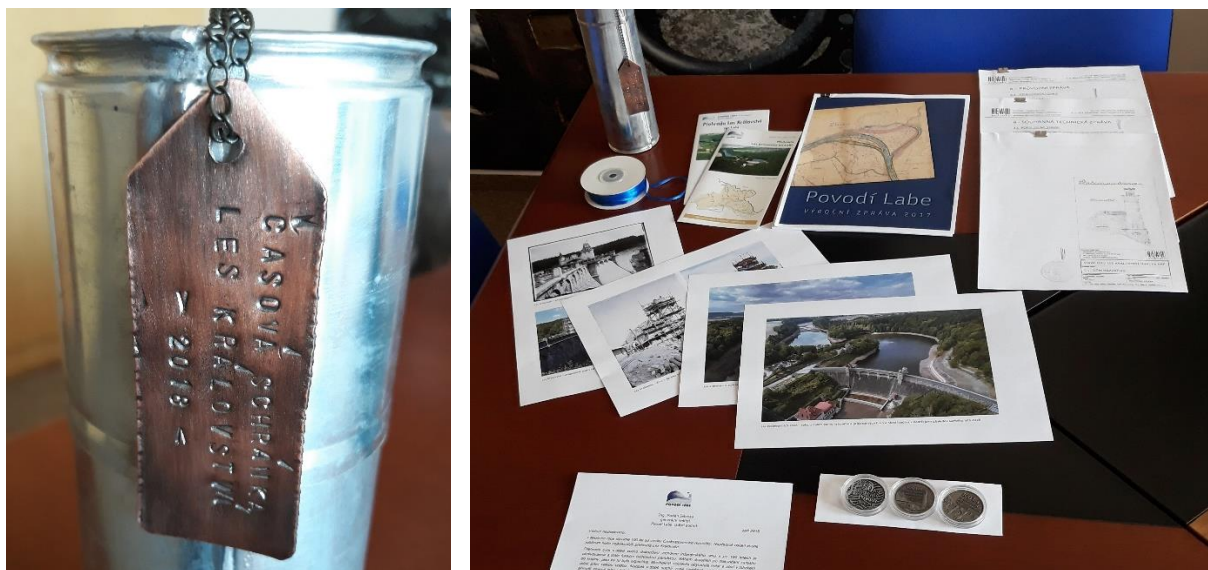
Materiály připravené na vložení do schránky

Na následujících obrázcích si můžete prohlédnout, jak to všechno vznikalo: