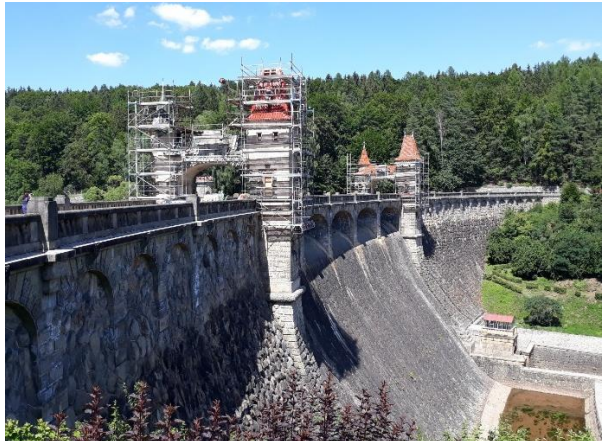
Les Království – průjezdové brány na hrázi při výstavbě v roce 1916 a při rekonstrukci v roce 2018