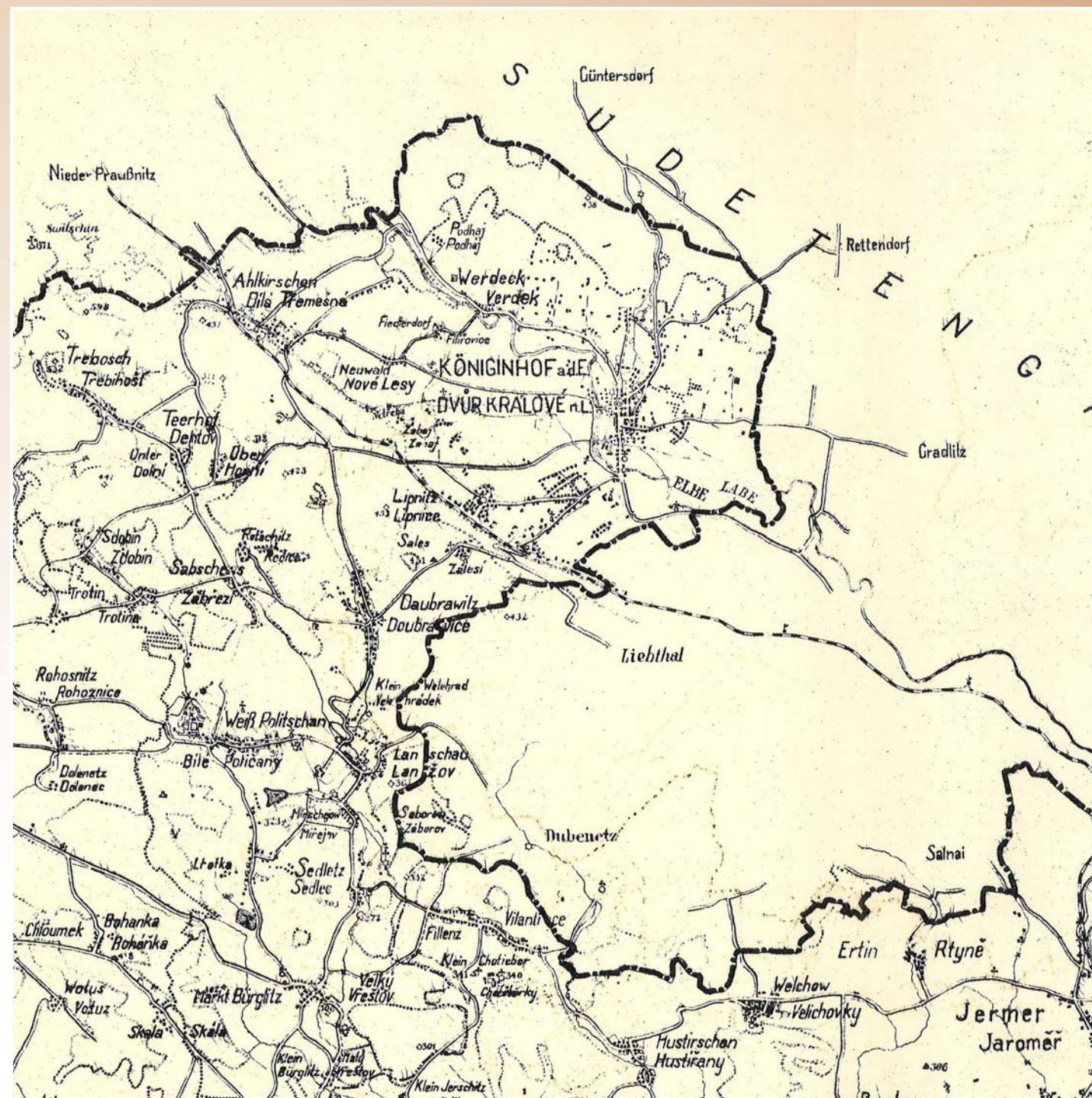
Půběh státní hranice na podzim 1938

Až 3.1.1939 byla provedena „...korektura hranic na levém břehu přehrady a sice tak, že do ČSR přišla ještě levá šoupátková věž, levá přepadavá šachta a část těsnící zdi...“ (služební kniha)