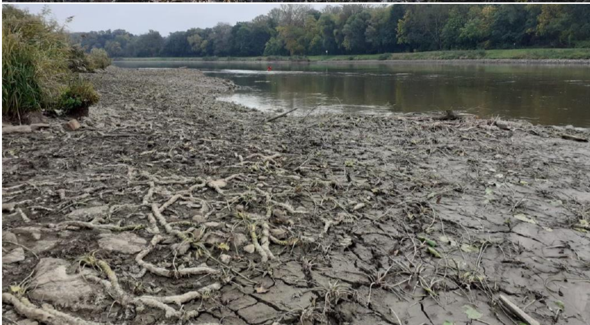
Sběr a transfer vodních mlžů