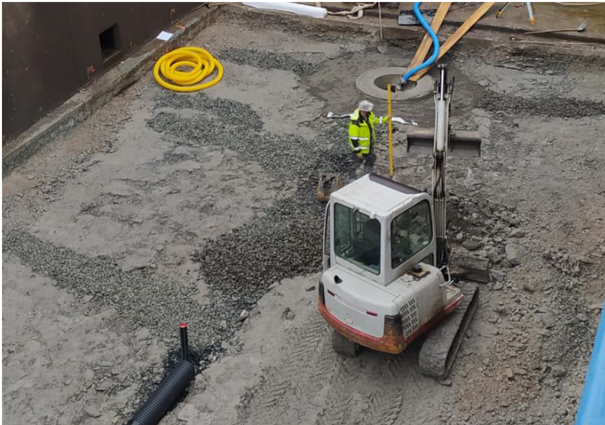
Betonáže podkladních betonů