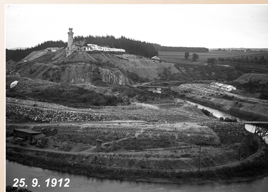
Celkový pohled na údolí Labe se stavenišťem vlevo

MÍSTNÍ STAVEBNÍ SPRÁVA NÁDRŽE V BÍLÉ TŘEMEŠNÉ