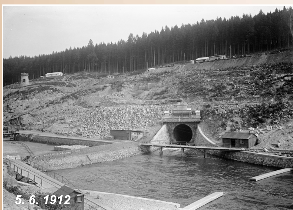
Levý obtok, údolí je již přehrazeno

V roce 1912 byla již voda převedena do obtokových tunelů. V místě budoucí hráze probíhala betonáž dna výkopu v hloubce 7-9 metrů pod dnem řečiště. Na podzim 1912 začali dělníci se zděním hráze.