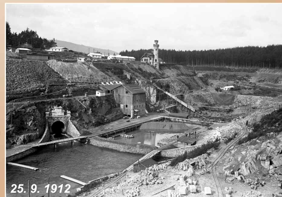
Celkový pohled, vpravo dole lom s připravenými kamennými bloky