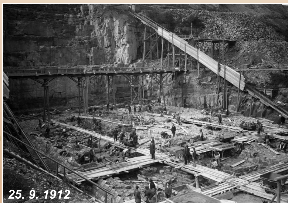
Počátek zdění hráze