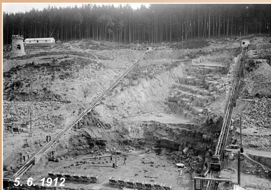
Betonáž dna výkopu v místě budoucí hráze