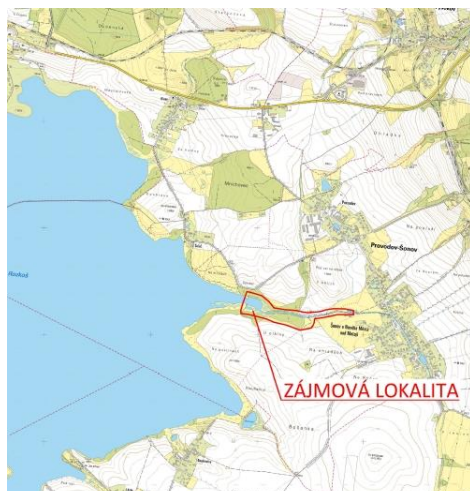
Domkovská zátoka v jižní nádrži VD Rozkoš

Biodiverzita v údolní nivě bude podpořena zřízením čtyř různě hlubokých a různě osluněných neprůtočných tůň.