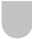
Žďár nad Orlicí