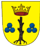
Třebechovice pod Orebem