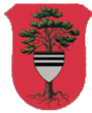
Týniště nad Orlicí