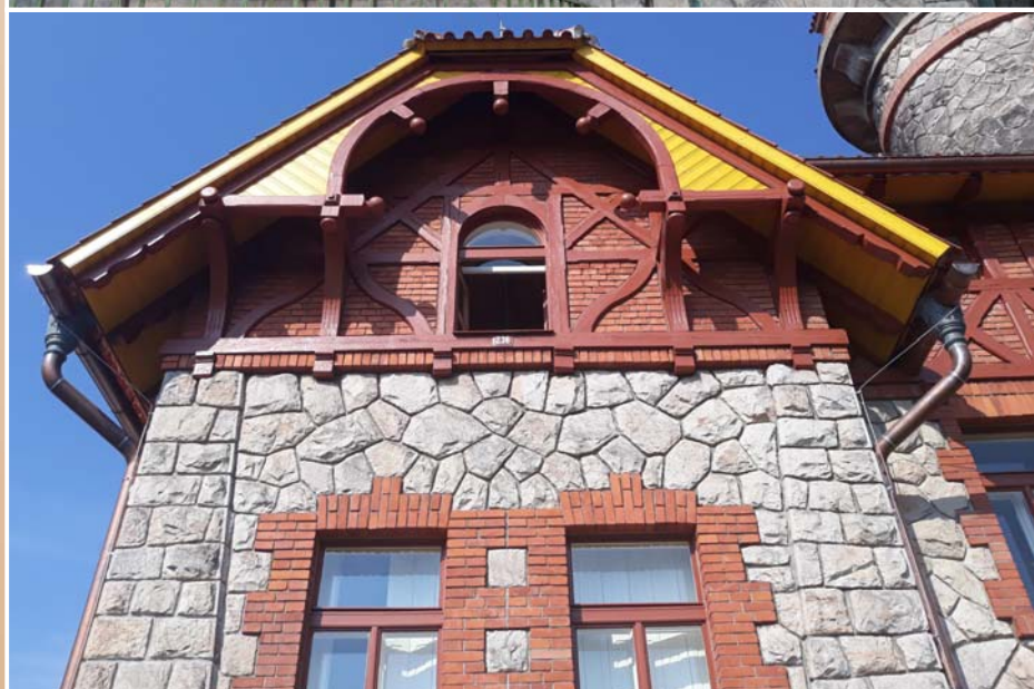
Dům hrázného před a po rekonstrukci