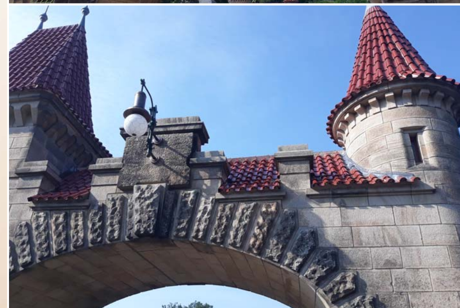
Levá průjezdová brána před a po rekonstrukci