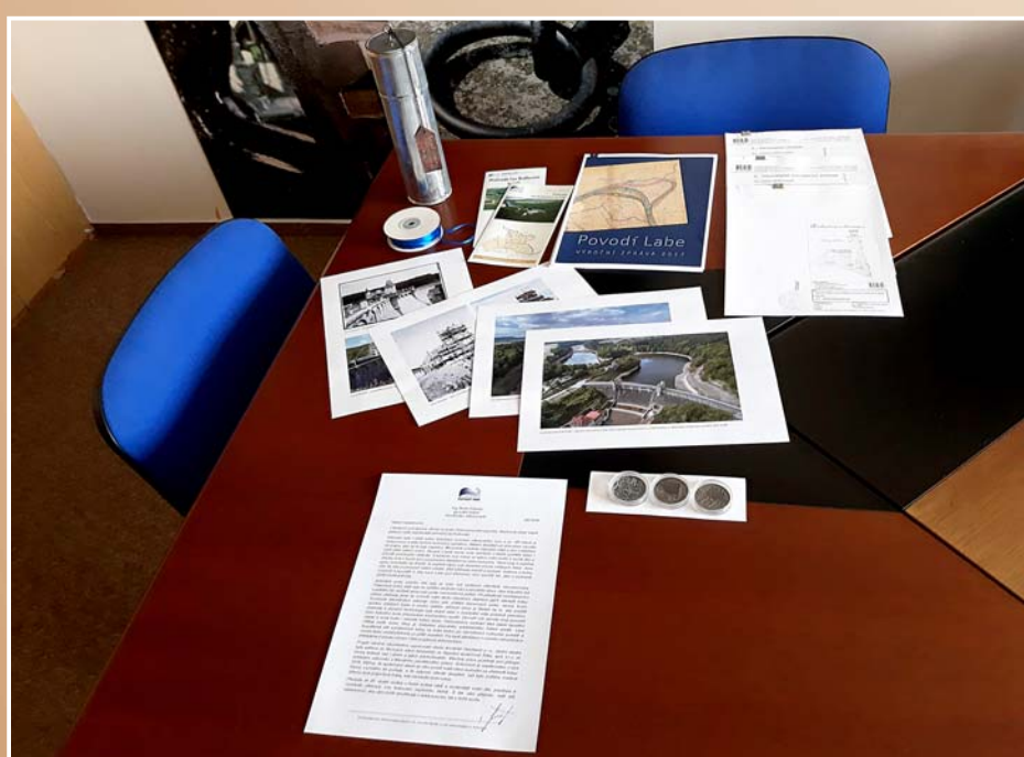
Materiály připravené do časové schránky