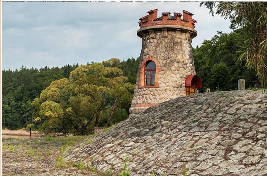
Levá šoupátková věž před a po rekonstrukci

V letech 2018 – 2019 provedl státní podnik Povodí Labe opravu a renovaci všech budov, které tvoří komplex národní kulturní památky. Práce probíhaly zejména na budově domu hrázného a přilehlých hospodářských budovách. Do původní podoby byly zrekonstruovány také další památkově chráněné objekty, tedy levá šoupátková věž a obě průjezdové brány na hrázi. S ohledem na památkovou ochranu byly při rekonstrukci budov použity materiály a stavební prvky, které odpovídaly historickým originálům, stejně tak jako tradiční stavební postupy.