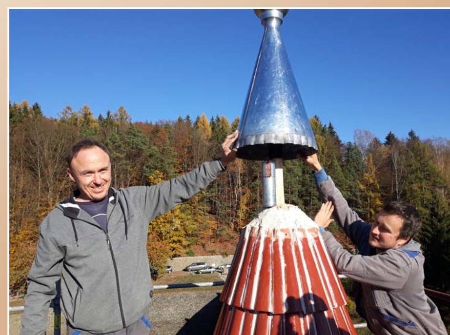
Uložení časové schránky

Od 31. 10. 2018 je schránka uložena v samé špičce věžičky levé průjezdové brány, kde bude několik desetiletí čekat na své objevitele.