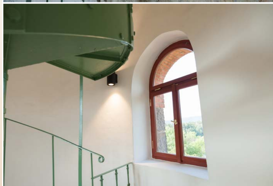
Interiér pravé šoupátkové věže před a po rekonstrukci