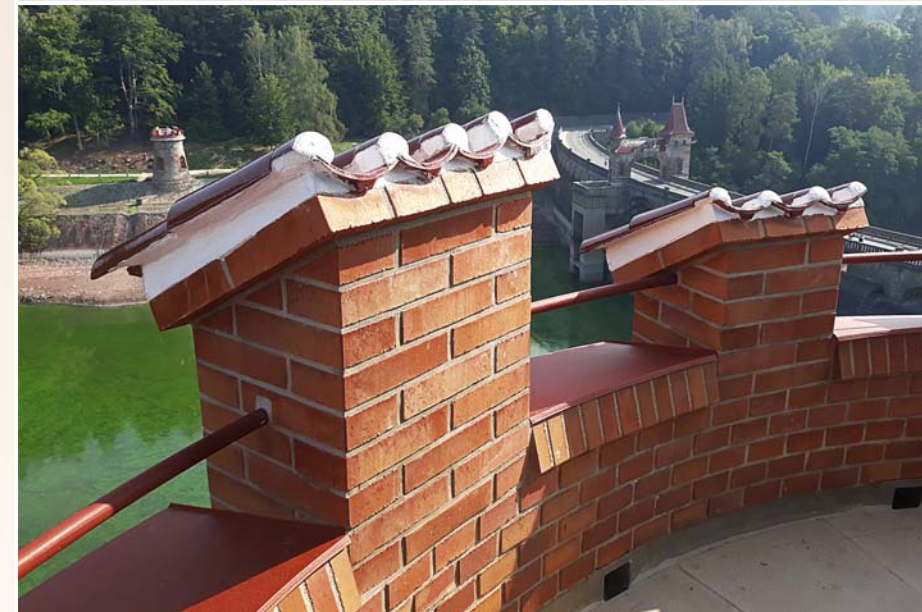
Ochoz pravé šoupátkové věže před a po rekonstrukci